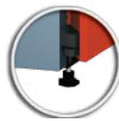
Kazán szintező lábak