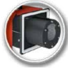
FIREBLAST automata pellet égőfej