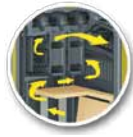
4-huzamú füstgáz hőcserélő