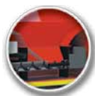
Hőcserélő felett elhelyezett tüzelőanyag tartály