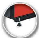
Lábak segítségével állítható kazán magasság