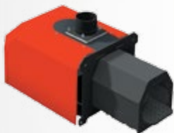
FIREBLAST automata égőfej, mozgórostéllyal