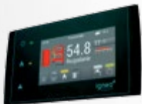
ESTYMA TOUCH vezérlés színes érintőkijelzővel