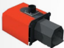
FIREBLAST égőfej automatikus tisztítással