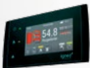
ESTYMA TOUCH - érintőképernyős kazánvezérlés